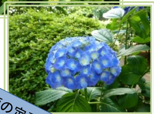
梅雨の定番、紫陽花