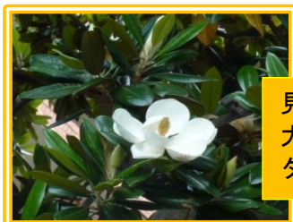
見上げれば、 大きな花卉の タイサンボク