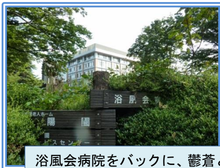
浴風会病院をバックに、鬱蒼と生える草木