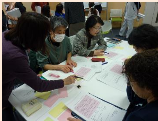
(グループワークの様子)